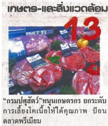
“กรมปศุสัตว์” หนุนเกษตรกร ยกกระตือรือร้นการเลี้ยงโคเนื้อให้ได้คุณภาพ ป้อนตลาดพรีเมียม