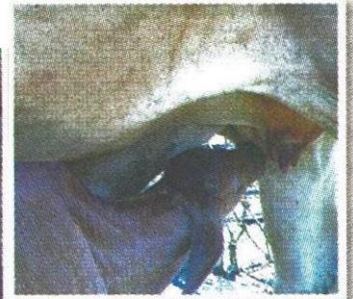
ลูกวัวอายุ 7 วัน กำลังดูดนมแม่