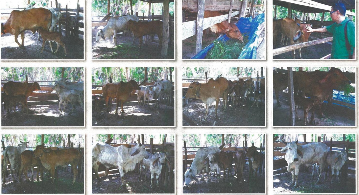
บ้านหลังใหม่ของพวกเขา