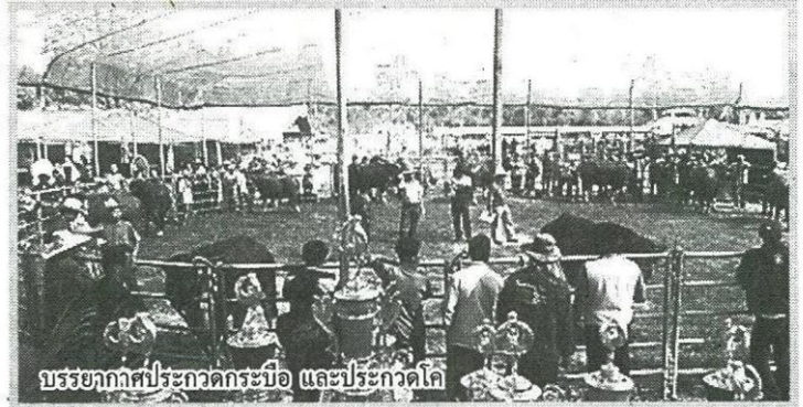
บรรยากาศประกวดกระบือ และประกวดโค

เมื่อช่วงสัปดาห์ที่ผ่านมา มหาวิทยาลัยนครพนม (ม.นพ.) กระทรวงเกษตรและสหกรณ์จังหวัดนครพนม องค์การบริหารส่วนจังหวัด (อบจ.) นครพนม ได้ร่วมกันจัดงานเกษตรลุ่มน้ำโขง ครั้งที่ 17 "Green City of Nakhon Phanom" ณ คณะเกษตรและเทคโนโลยี ม.นพ.