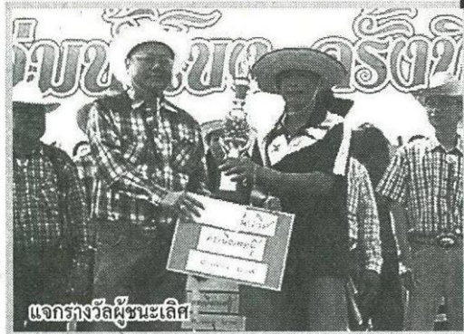
แจกรางวัลผู้ชนะเลิศ